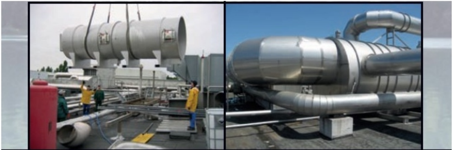
Effektive Wärmerückgewinnung und Säuberung der Abluft durch Aussprühen mit Wasser im Energiesprühtunnel