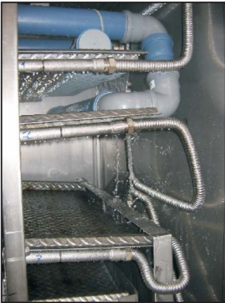
Energierückgewinnung aus heißen Abwässern